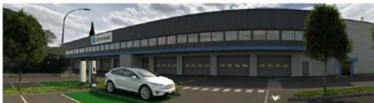
MARSEILLE (13) 199, avenue Ibrahim Ali

Il est exploité par un locataire de qualité et pérenne (Chronopost) dans le cadre d'un bail de 10 ans dont 9 ans fermes.